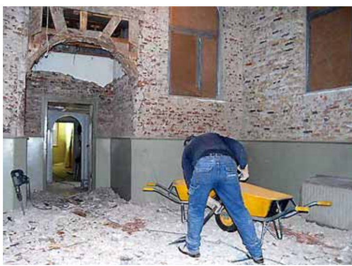
De sporen van de baptistengemeenschap worden 'gewist'.