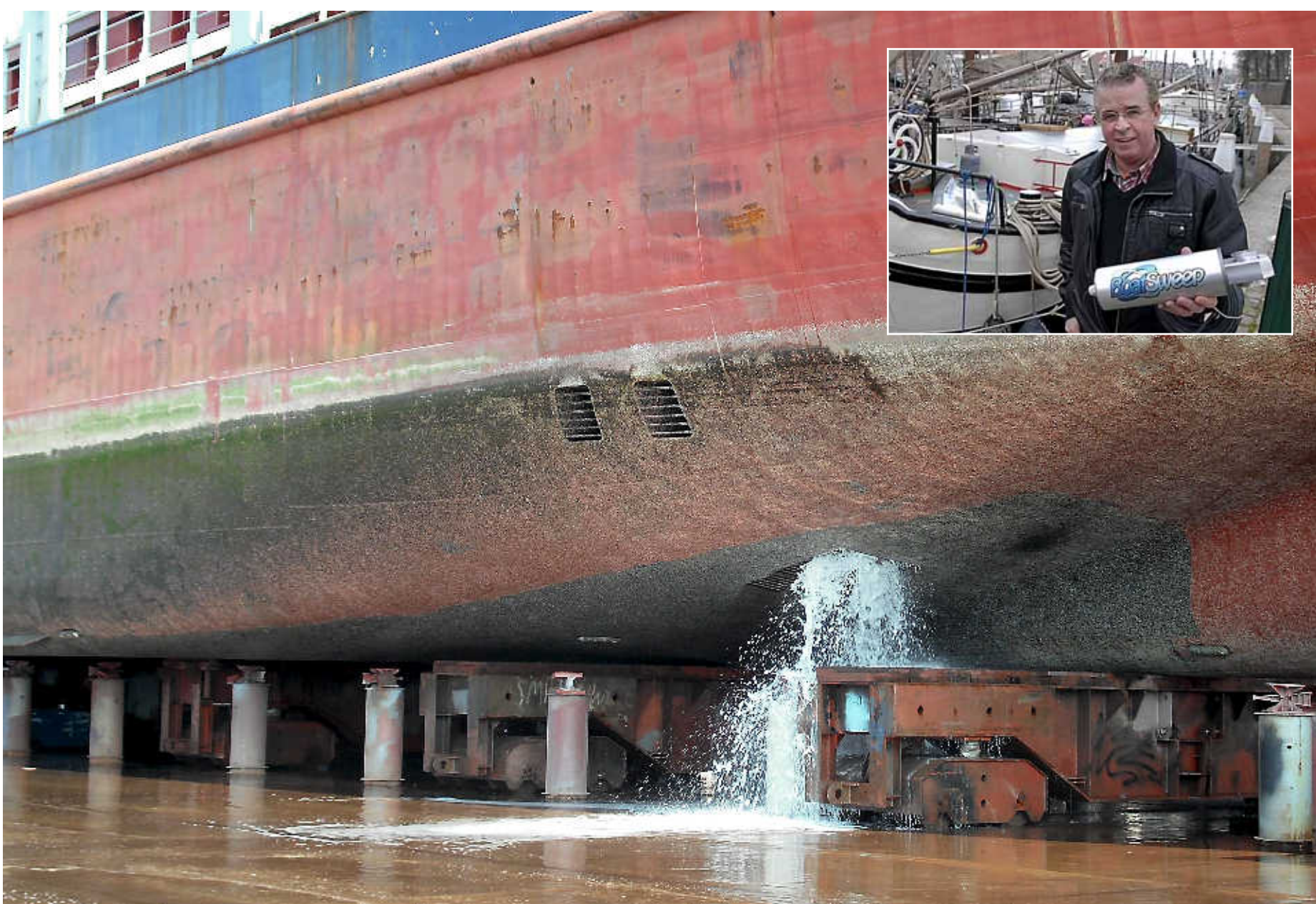
De Nova Cura die onder water vol zeepkoken zat (foto), is dankzij Kees Luykx en zijn Ultrasound apparaten (inzet) nu een sneller en stiller schip.