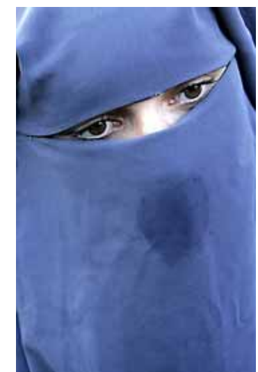
Een boerkadraagster.

In de Tweede Kamer is opschudding ontstaan door uitspraken van de Amsterdamse korpschef Bernard Welten. In het tv-programma 5 jaar later zei hij dat de politie in Amsterdam geen vrouwen met een boerka zal arresteren.