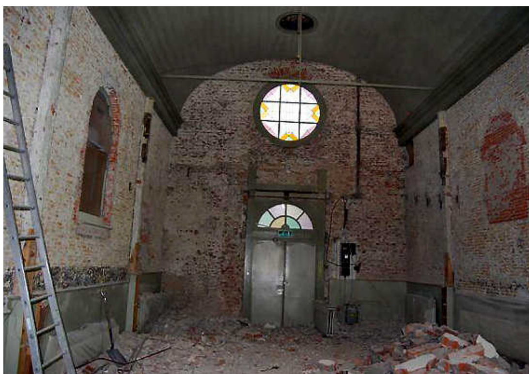
Het geheel gestripte interieur van de synagoge aan de Alkmaarse Hofstraat.

Alkmaar kent een lange joodse traditie. De joodse gemeenschap kocht het gebouw aan de Hofstraat in de Alkmaarse binnenstad in 1802. Alkmaar telde toen zo'n tachtig joodse gezinnen. In de loop van de negentiende eeuw breidde de gemeenschap zich uit en in 1826 werd een nieuwe voorgevel aangebracht. De ruimte werd verbreed met een tongewelf en een galerij voor vrouwen. De eerste joden vestigden zich in 1613 in Alkmaar. Daarmee was Alkmaar een van de